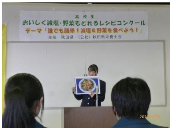
おいしく減塩・野菜もとれるレシピコンクール