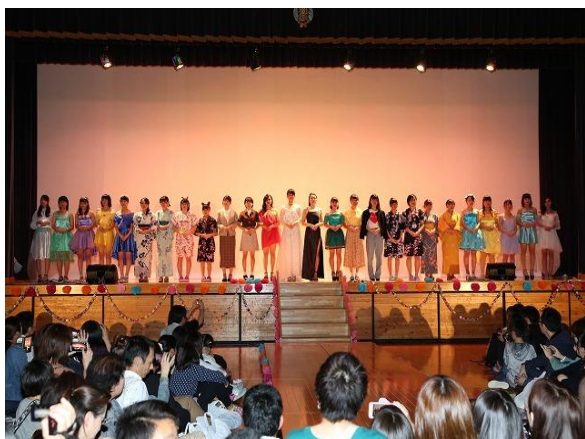
大農祭でのファッションショー